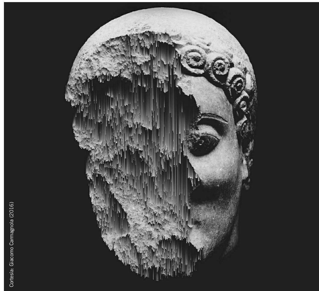
Cortesía: Giacomo Carmagnola (2016)

923 294550 ext. 1430 y 1449 acs@usal.es panera@usal.es